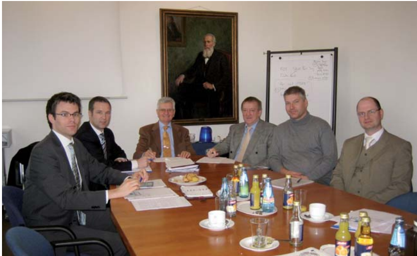
Arbeitstreffen des National Monitoring Committee im „Euler-Zimmer“ des VDI

Bachelor- und Masterabschluss hat sich mittlerweile gut etabliert. Dabei hat sich insbesondere ASIIN von Anfang an auf die Akkreditierung von Ingenieurstudiengängen spezialisiert und dazu schon frühzeitig Outcome-orientierte Kriterien entwickelt und in den Akkreditierungsverfahren angewendet. Als aktiver Partner im EUR-ACE®-Projekt und Gründungsmitglied von ENAEE ist es ASIIN gelungen, sich als eine der ersten Akkreditierungsagenturen in Europa für die Vergabe des EUR-ACE®-Labels zu qualifizieren (siehe den ASIIN Newsletter Nr. 1 vom Dezember 2007). Damit erfüllt sie voll die Kriterien für Zusammenarbeit, die FEANI an eine Akkreditierungsagentur stellt.