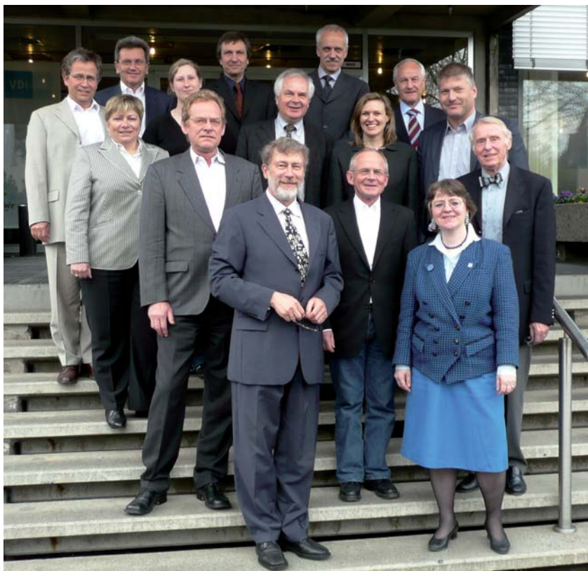
Mitglieder der Akkreditierungskommission für Qualitätsmanagementsysteme (AK Systeme)

Bei der konstituierenden Sitzung der neuen Akkreditierungskommission für Qualitätsmanagementsysteme hatten ihre Mitglieder bereits ein ansehnliches Arbeitspensum zu absolvieren: So hat die Akkreditierungskommission die Anforderungen und Verfahrensgrundsätze der ASIIN e. V. für die Akkreditierung von Qualitätsmanagementsystemen beraten und verabschiedet. Diese werden den antragstellenden Hochschulangehörigen, den Gutachterinnen, Gutachtern und Gremienmitgliedern als Handbuch für die Vorbereitung und Durchführung der Verfahren zur Systemakkreditierung dienen. Sie werden darüber hinaus regelmäßig überprüft und im Lichte der gewonnenen Erfahrungen und neuen Erkenntnisse weiter entwickelt werden.