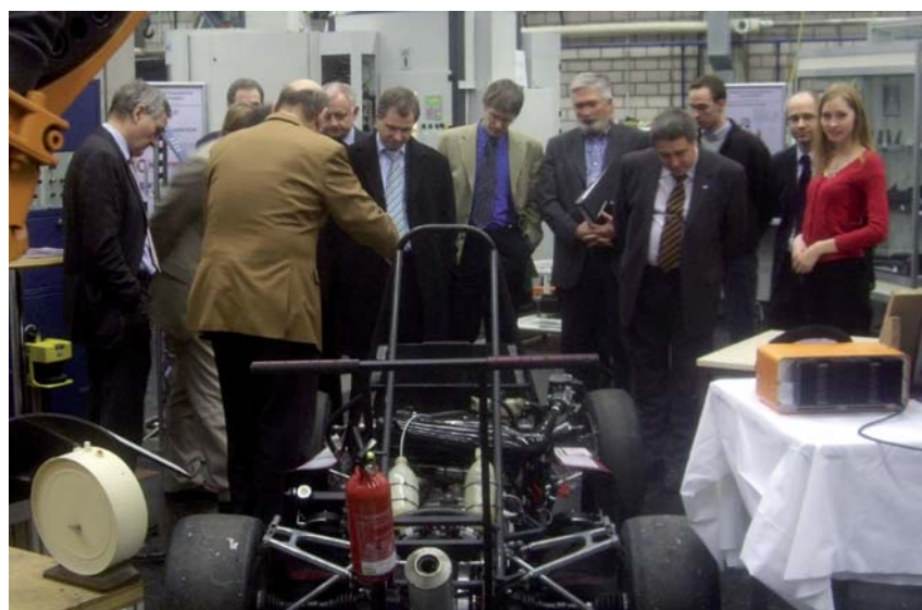
Besichtigung von Forschungseinrichtungen der Hochschule Karlsruhe