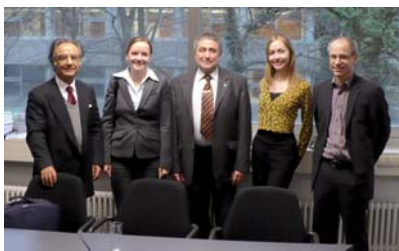
Internationales Gutachterteam und Mitarbeiter der ASIIN-Geschäftsstelle

ASIIN hat im Januar 2008 als erste der sechs Agenturen ein Akkreditierungsverfahren an der Hochschule Karlsruhe von einem internationalen Gutachterteam aus